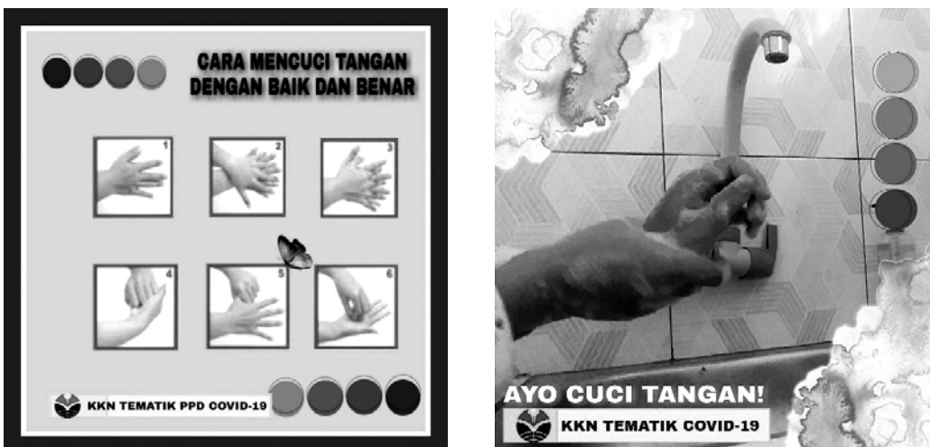
Gambar 3 Sosialisasi cara mencuci tangan dengan baik melalui poster dan video