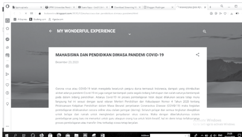
Gambar 5 Bukti publikasi artikel kegiatan KKN pada platform Online