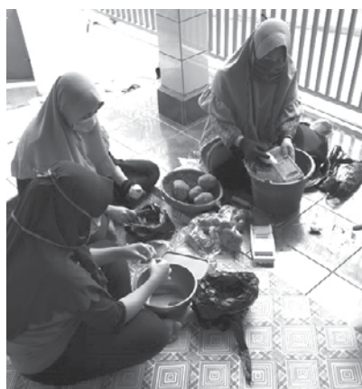
Gambar 6 Membina hobi ibu rumah tangga yang bekerjasama dengan kader RW 09