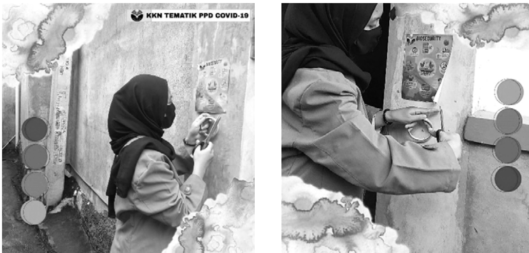
Gambar 1 Penempelan poster di area Dusun Citeureup