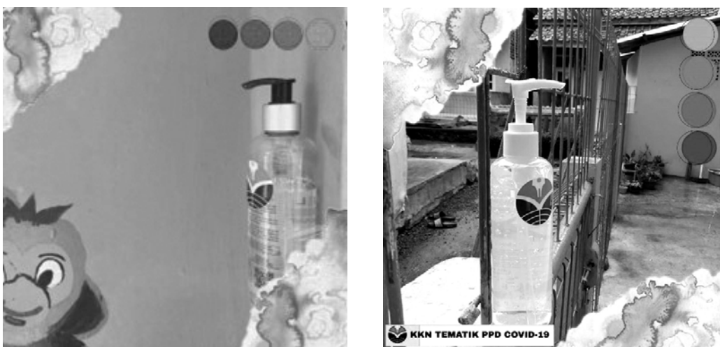
Gambar 2 Penyaluran APD berupa handsanitizer di RA Rahayu Jatinangor