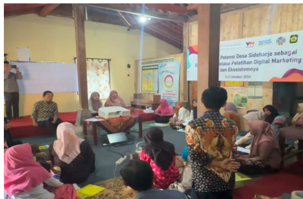
Gambar 6 : Pemaparan para narasumber serta sesi tanya jawab